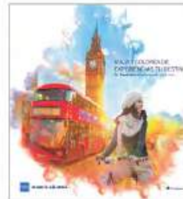
3A DE FORROS