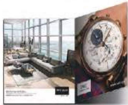
3a DE FORROS