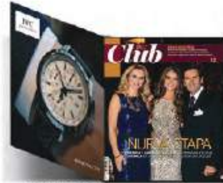
2a DE FORROS